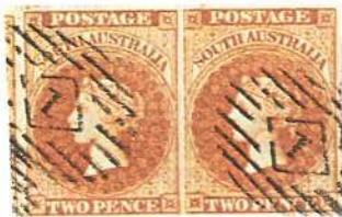
Tira horizontal de cinco sellos de 1 céntimo, verde oliva, de Francia (1870). A la izquierda: un par de 2 peniques, bermellón, emitido por Australia del Sur en 1855.