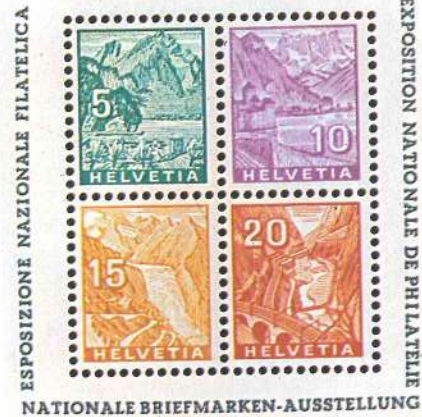
Suiza: la hoja bloque que contiene cuatro sellos de distinto valor, que fue emitida en 1934 con motivo de la Exposición Nacional de Filatelia.