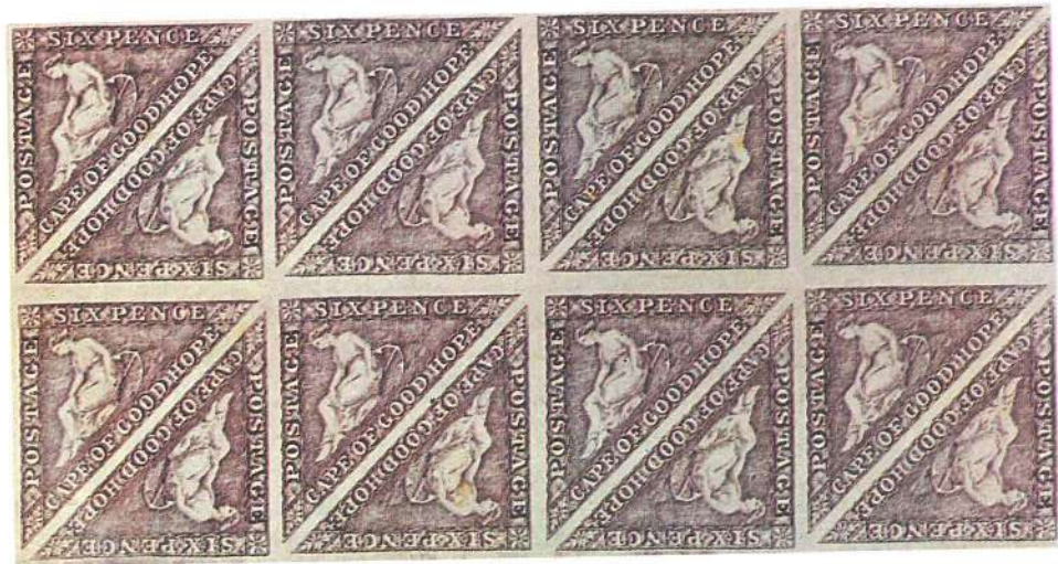
Cabo de Buena Esperanza, 1863: bloque de dieciséis unidades, uno de los más grandes que se conocen, del sello triangular de 6 peniques, color malva vivo. Los primeros sellos de la colonia de El Cabo eran triangulares, quizá para facilitar el corte mediante tijera.

llevada a cabo por Suiza en el tarde por otros algunos Estados, Corea del Sur, sellos en hojas pequeñas. Es Corea y en cual no siempre con los, sino que las plar único o de iguales o con que componen ta palabra, «se menudo en el atelia; denomina nado de sellos en su concepción o que tienen el que han aparecido odo, pero que se sí por los distin- nales y casi siem-